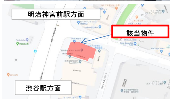
明治神宮前駅方面