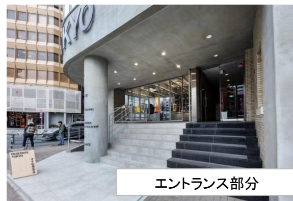
エントランス部分